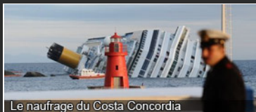
Le naufrage du Costa Concordia