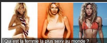
Qui est la femme la plus sexy au monde ?