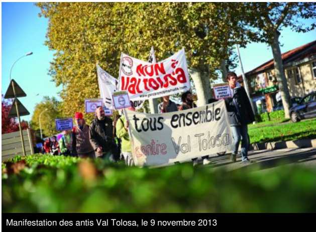
Manifestation des anti Val Tolosa, le 9 novembre 2013